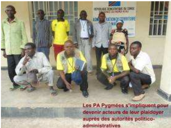
Les PA Pygmées s'impliquent pour devenir acteurs de leur plaidoyer auprès des autorités politico-administratives.

Dans le souci de voir un jour les peuples autochtones Pygmées jouir de leurs droits, nous avons menés des plaidoyers auprès des autorités politico-administratives, foncières et Chefs coutumiers. Pour cette année, 9 missions de plaidoyer ont été organisées dont 7 dans le Territoire de Masisi et 2 dans le Territoire de Walikale.